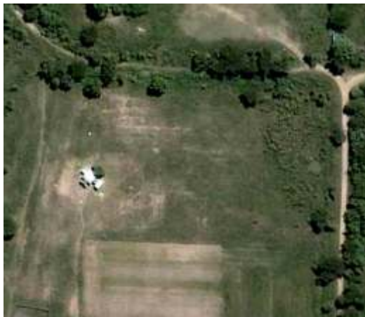
Vista satelital del Parque Kohanoff

El Parque Kohanoff es un lugar abierto a la reflexión, al intercambio y al encuentro entre las personas, para profundizar en nosotros mismos y con los demás.